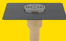
SitaMini, recht (verticale uitloop)