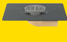
SitaMini, gebogen (zijdelingse uitloop)