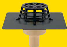
SitaCompact, recht (verticale uitloop)