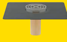
SitaMini afvoerkolk voor garage