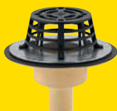
SitaCompact schroefflens, recht (verticale uitloop)