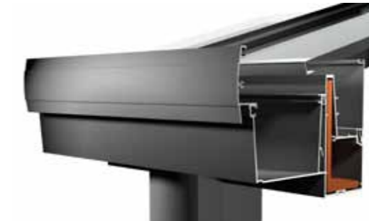
Type 4 XXL

Deze veranda is uitgevoerd met een moderne goot, passend bij een hedendaagse bouwstijl. Minimalistisch design en bijpassende staanders kenmerken dit daktype.